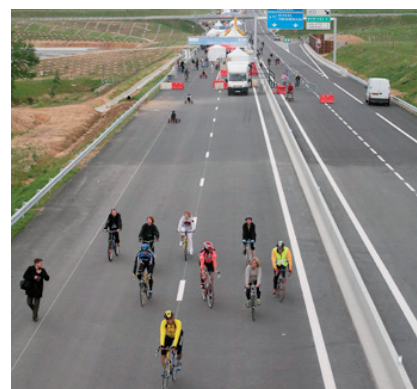
Inauguration de l'A19 △