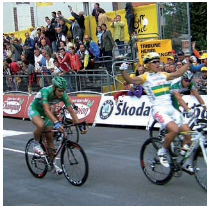
△ Vainqueur de l'étape de Montargis en 2005 Robbie Mac Ewen

Le parcours du Tour de France 2010 a été dévoilé hier à Paris. Il se déroulera du samedi 3 au dimanche 25 juillet 2010 et comptera un prologue et 20 étapes pour une distance totale de 3 600 kms.