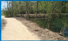
Etangs de l'AME P.3