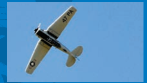
Show aérien P.4