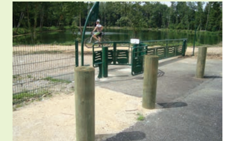
△ Mise en place d'un accès pour les vélos

Un plan d'actions pluriannuel ayant pour objectif de mettre en valeur le plan d'eau de l'AME à Puy-la-Laude, jusqu'alors impraticable, a été déterminé et l'année 2012 a marqué le début des travaux d'aménagement.