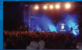
Musik'air 2012 P.4