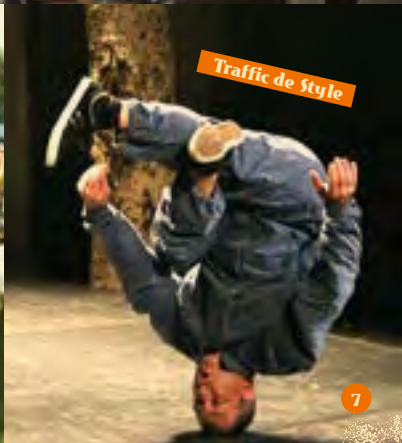
Traffic de Style