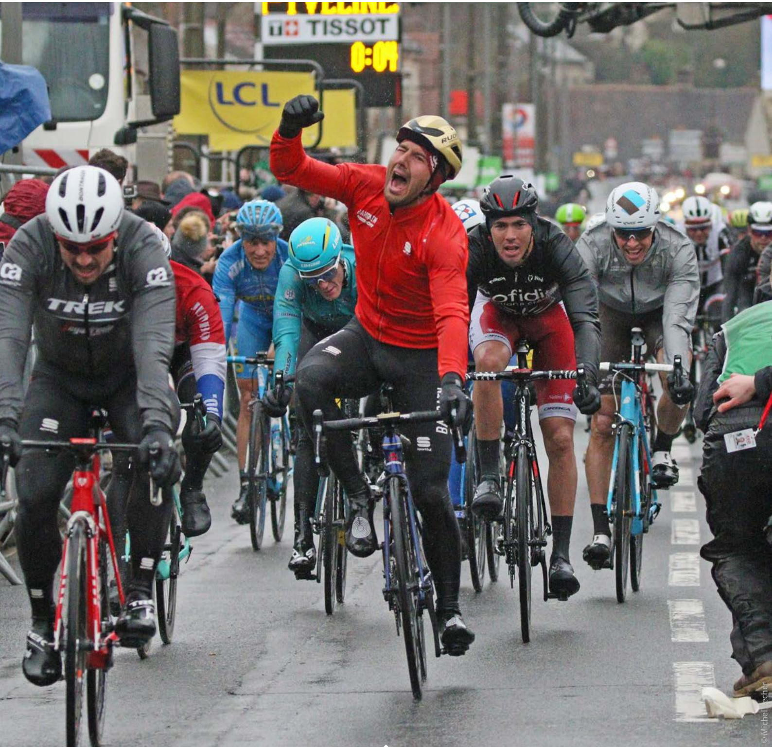
Arrivée de la 2 e étape du Paris-Nice - Rochefort-en-Yvelines/Amilly

Amilly • Cepoy • Chalette-sur-Loing • Chevillon-sur-Huillard • Conflans-sur-Loing • Corquilleroy • Lombreuil • Montargis • Mormant-sur-Vernisson • Pannes • Paucourt • St Maurice-sur-Fessard • Solterre • Villemandeur • Vimory