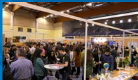
Forum de l'orientation P. 3