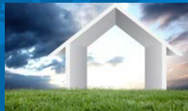
Service Éco Habitat P. 4