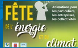
Fête de l'Énergie et du Climat P. 4