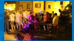
Visites au clair de lune P. 6