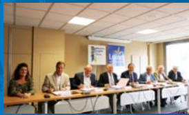
Signature du Contrat Départemental P. 3