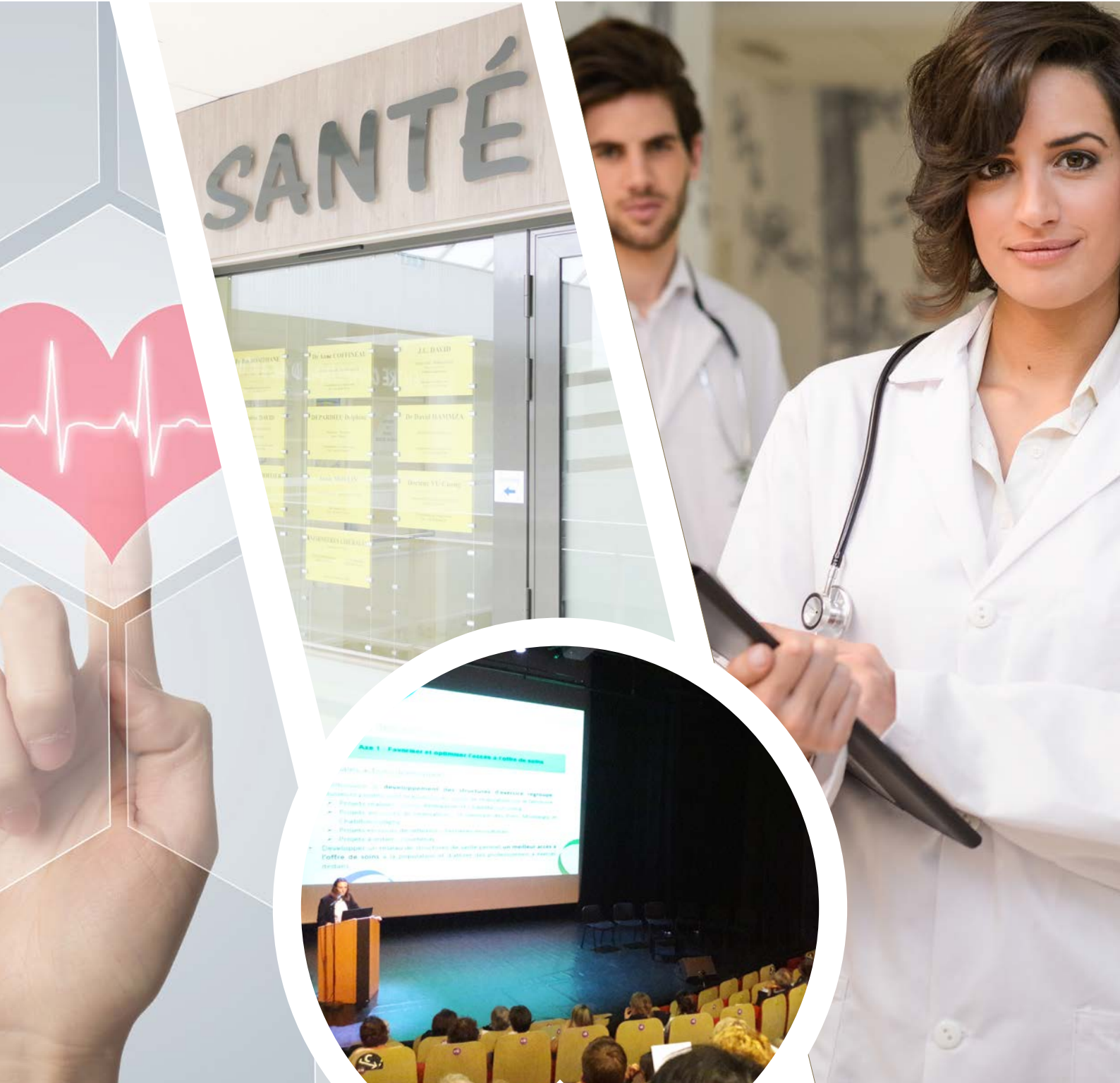
Forum - Bilan à mi-parcours du Contrat Local de Santé du Montargois en Gâtinais - 17 octobre 2017

Amilly • Cepoy • Chalette-sur-Loing • Chevillon-sur-Huillard • Conflans-sur-Loing • Corquilleroy • Lombreuil • Montargis • Mormant-sur-Vernisson • Pannes • Paucourt • St Maurice-sur-Fessard • Solterre • Villemandeur • Vimory